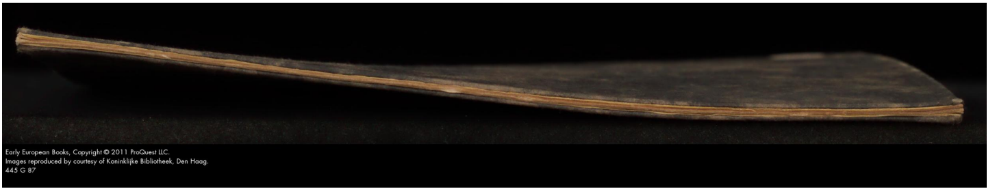
445 G 87